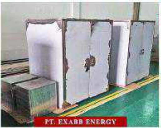
PT. EXABB ENERGY