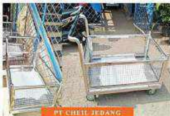
PT CHEIL JEDANG