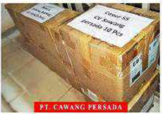
PT. CAWANG PERSADA