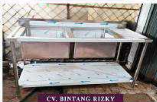
CV. BINTANG RIZKY