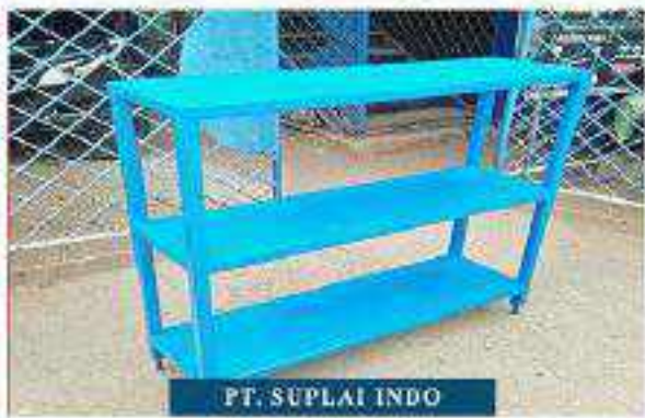
PT. SUPLAI INDO