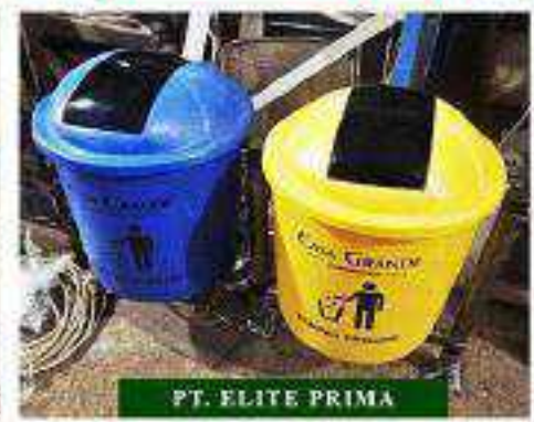
PT. ELITE PRIMA