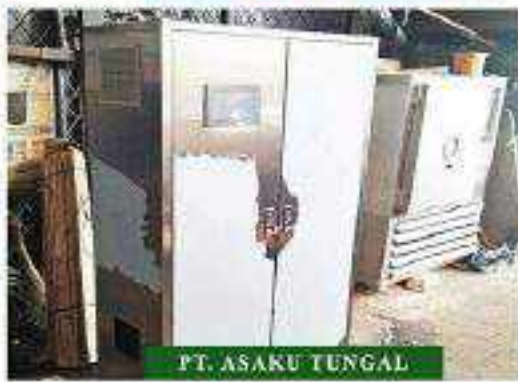
PT. ASAKU TUNGGAL