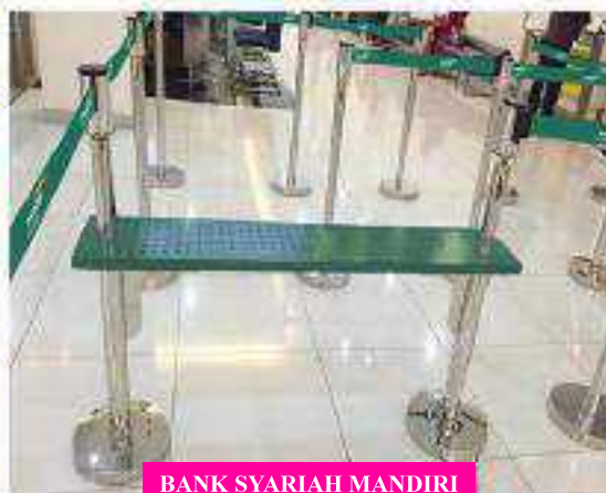
BANK SYARIAH MANDIRI