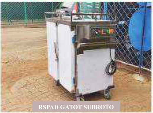
RSPAD GATOT SUBROTO